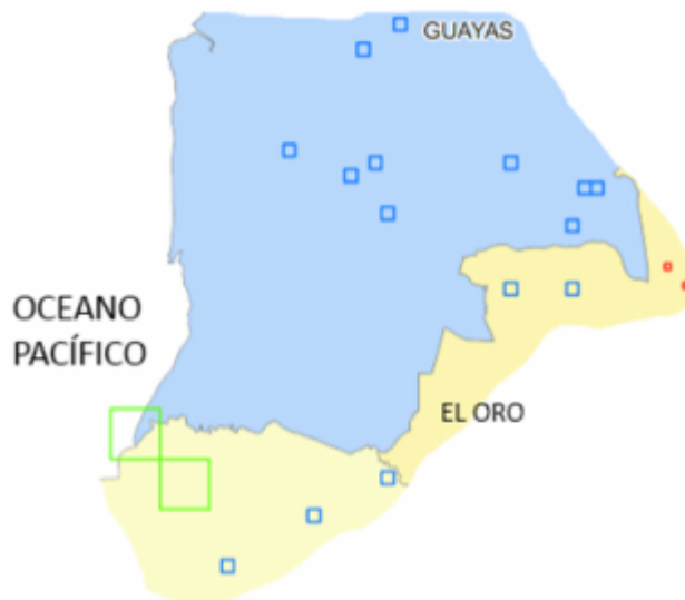
Gráfico 1.- Segmento de investigación de ESPAC con superficie en otra provincia y fuera del universo de estudio.