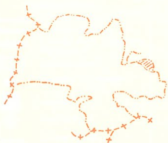
UBICACION DE LA PARROQUIA