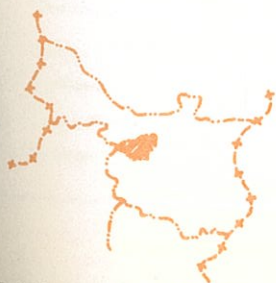
UBICACION DE LA PARROQUIA