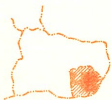
UBICACION DE LA PARROQUIA