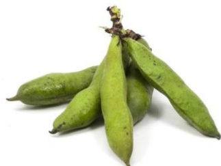
Fig. 1 Haba variedad serrana en vaina

Finalmente se adjunta imágenes del haba variedad serrana y la habichuela.