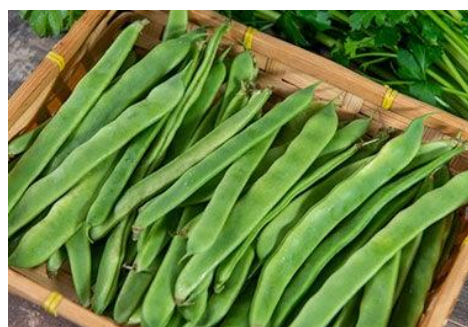
Fig. 2 Habichuela