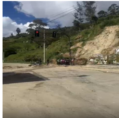
MANIFESTANTES EN LA VIA COLOCANDO TIERRA Y PIEDRAS