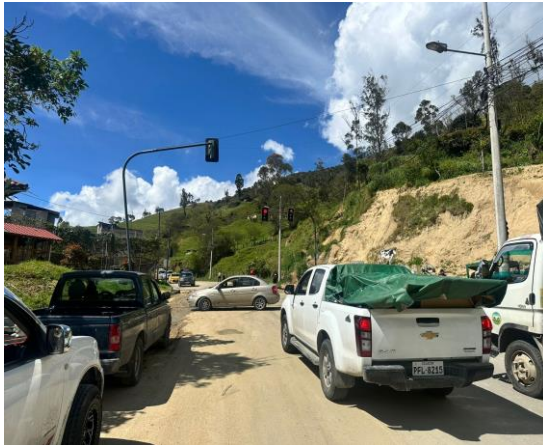
CIERRE VIAL EN EL PUNTO SAN LUCAS PROVINCIA DE LOJA