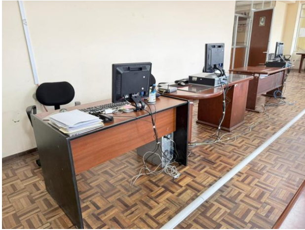
Grafico N° 4. CAB-SIPCE ahora