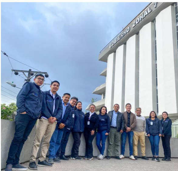
Grafico N° 2. Equipo de Loja