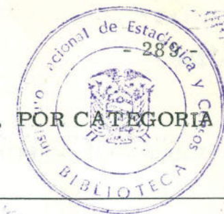
Tabla N° 22. - POBLACION DE 12 AÑOS Y MAS DEL CANTON RIOBAMBA, ECONOMICAMENTE ACTIVA, POR CATEGORIA DE OCUPACION Y SEXO, SEGUN GRUPOS DE EDAD