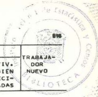
CUADRO 8 .- POBLACION ECONOMICAMENTE ACTIVA, POR RAMA DE ACTIVIDAD ECONOMICA, SEGUN SEXO Y GRUPOS DE EDAD