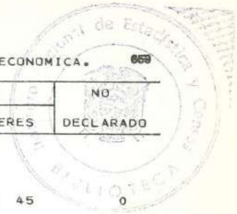
CUADRO 17.- POBLACION ECONOMICAMENTE ACTIVA, POR CONDICION DE ALFABETISMO Y SEXO, SEGUN RAMA DE ACTIVIDAD ECONOMICA. 058