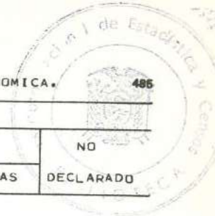
CUADRO 16 - POBLACION FEMENINA ECONOMICAMENTE ACTIVA, POR NIVEL DE INSTRUCCION, SEGUN RAMA DE ACTIVIDAD ECONOMICA.