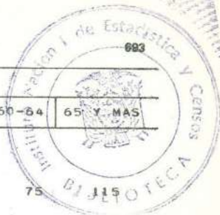
CUADRO 7.- POBLACION ECONOMICAMENTE ACTIVA, POR GRUPOS DE EDAD, SEGUN GRUPOS PRINCIPALES DE OCUPACION.