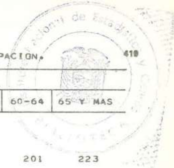
CUADRO 7.- POBLACION MASCULINA ECONOMICAMENTE ACTIVA, POR GRUPOS DE EDAD, SEGUN GRUPOS PRINCIPALES DE OCUPACION.