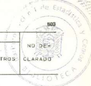
CUADRO 6.- POBLACION DE 12 AÑOS Y MAS, POR CLASIFICACION ECONOMICA, SEGUN SEXO Y GRUPOS DE EDAD.