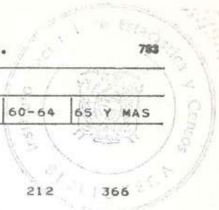
CUADRO 7.- POBLACION ECONOMICAMENTE ACTIVA, POR GRUPOS DE EDAD, SEGUN GRUPOS PRINCIPALES DE OCUPACION.