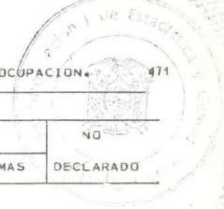
CUADRO 16.- POBLACION FEMENINA ECONOMICAMENTE ACTIVA, POR NIVEL DE INSTRUCCION SEGUN GRUPOS PRINCIPALES DE OCUPACION. 471