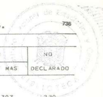
CUADRO 14- POBLACION ECONOMICAMENTE ACTIVA, POR NIVEL DE INSTRUCCION, SEGUN SEXO Y GRUPOS DE EDAD.