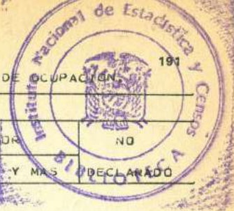
CUADRO 16.- PUBLACION FEMENINA ECONOMICAMENTE ACTIVA, POR NIVEL DE INSTRUCCION SEGUN GRUPOS PRINCIPALES DE OCUPACION