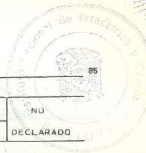
CUADRO 20- POBLACION ECONOMICAMENTE ACTIVA, POR NIVEL DE INSTRUCCION, SEGUN SEXO Y GRUPOS DE EDAD.