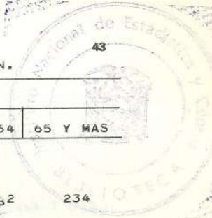
CUADRO 13.- POBLACION MASCULINA ECONOMICAMENTE ACTIVA, POR GRUPOS DE EDAD, SEGUN GRUPOS PRINCIPALES DE OCUPACION.