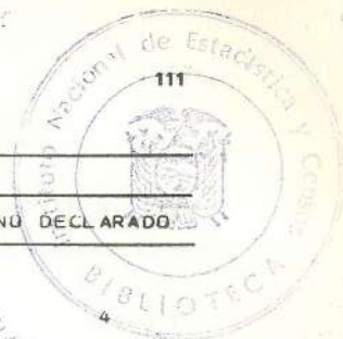
CUADRO 25.- POBLACION ECONOMICAMENTE ACTIVA, POR ESTADO CIVIL, SEGUN SEXO Y GRUPOS DE EDAD.