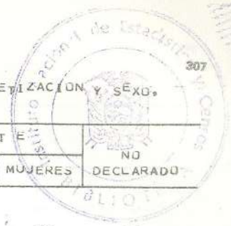
CUADRO 23.- POBLACION DE 6 A 14 AÑOS, POR ASISTENCIA A ESTABLECIMIENTOS DE ENSEÑANZA REGULAR Y CENTROS DE ALFABETIZACION, Y SEXO, SEGUN PARROQUIAS.