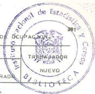
CUADRO 11.- POBLACION FEMENINA ECONOMICAMENTE ACTIVA, POR CATEGORIA DE OCUPACION, SEGUN GRUPOS PRINCIPALES DE OCUPACION.