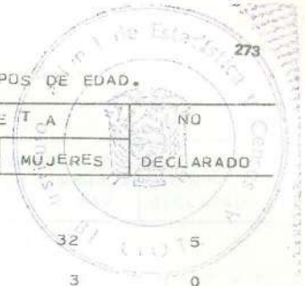
CUADRO 13.- POBLACION ECONOMICAMENTE ACTIVA, POR CONDICION DE ALFABETISMO Y SEXO, SEGUN AREAS Y GRUPOS DE EDAD.