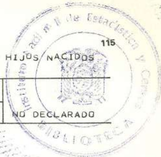
CUADRO 28.- POBLACION FEMENINA DE 15 AÑOS Y MAS, QUE TUVO SU ULTIMO HIJO NACIDO VIVO EN EL ULTIMO AÑO, POR NUMERO DE HIJOS NACIDOS VIVOS, SEGUN AREAS Y GRUPOS DE EDAD.