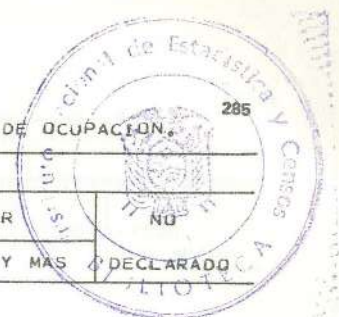
CUADRO 16.- Poblacion masculina económicamente activa, por nivel de instrucción, según grupos principales de ocupación.