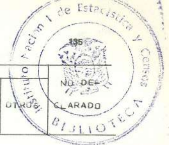
CUADRO 6 .- POBLACION DE 12 AÑOS Y MAS, POR CLASIFICACION ECONOMICA, SEGUN SEXO Y GRUPOS DE EDAD.