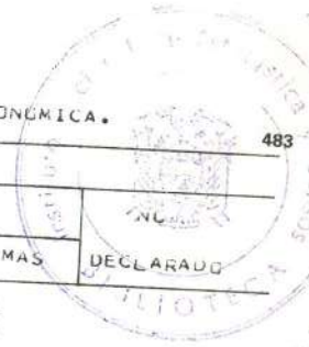
CUADRO 18.- POBLACION FEMENINA ECONOMICAMENTE ACTIVA, POR NIVEL DE INSTRUCCION, SEGUN RAMA DE ACTIVIDAD ECONOMICA.