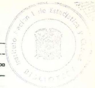
CUADRO N. 16G.- POBLACION FEMENINA ECONOMICAMENTE ACTIVA, POR NIVEL DE INSTRUCCION, SEGUN GRUPOS PRINCIPALES DE OCUPACION