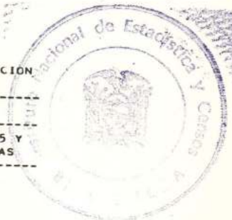
CUADRO N. 7E.- PUBLACION MASCULINA URBANA ECUNOMICAMENTE ACTIVA, POR GRUPOS DE EDAD, SEGUN GRUPOS PRINCIPALES DE OCUPACION