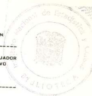
CUADRO N. 11B.- POBLACION URBANA ECONOMICAMENTE ACTIVA, POR CATEGORIA DE OCUPACION, SEGUN GRUPOS PRINCIPALES DE OCUPACION