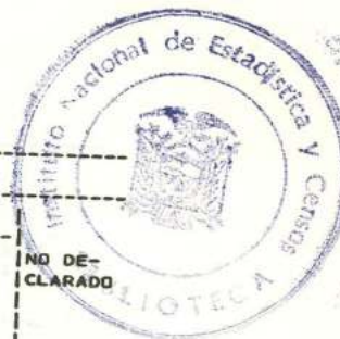
CUADRO N. 68.- POBLACION URBANA DE 12 AÑOS Y MAS. POR TIPO DE ACTIVIDAD. SEGUN SEXO Y GRUPOS DE EDAD