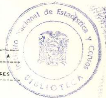
CUADRO N. 17A.- POBLACION ECONOMICAMENTE ACTIVA, POR CONDICION DE ALFABETISMO Y SEXO, SEGUN RAMA DE ACTIVIDAD ECONOMICA