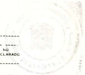
CJADRO N. 5B.- POBLACION URBANA DE 6 AÑOS Y MAS, QUE ASISTE A ESTABLECIMIENTOS DE ENSEÑANZA REGULAR Y DE ALFABETIZACION, POR NIVEL DE INSTRUCCION, SEGUN SEXO Y GRUPOS DE EDAD