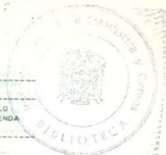
CUADRO N. 173.- VIVIENDAS PARTICULARES OCUPADAS DEL AREA URBANA, POR UTILIZACION DE LA VIVIENDA, SEGUN MATERIALES PREDOMINANTES EN EL TECHO, PAREDES Y PISO