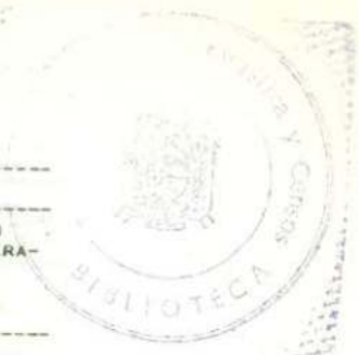
CUADRO N. 10C.- VIVIENDAS PARTICULARES OCUPADAS DEL AREA RURAL, POR TIPO DE VIVIENDA, SEGUN MATERIALES PREDOMINANTES EN EL TECHO, PAREDES Y PISO