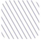
Tabla de Ilustraciones