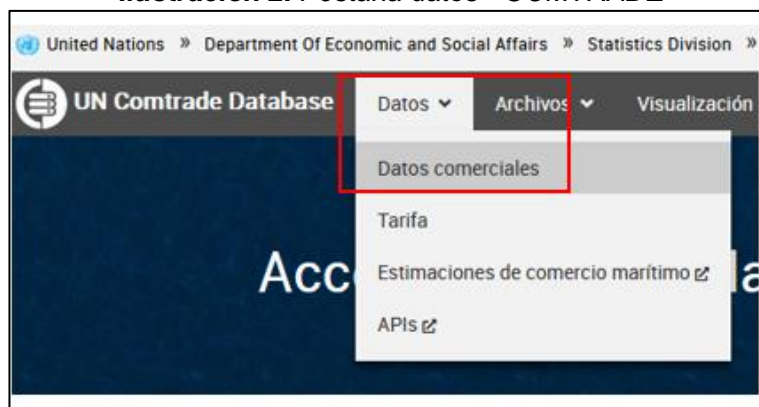
Ilustración 2. Pestaña datos - COMTRADE