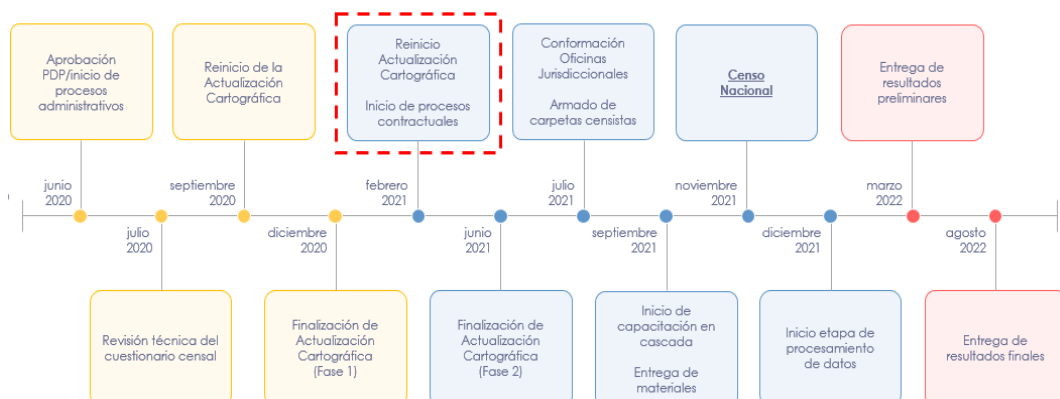
Ilustración 1: Hoja de ruta – reprogramación del Proyecto CPV

A continuación, procede a exponer la Hoja de ruta para la reprogramación del Proyecto CPV, resaltando que en febrero de 2021 se dio inicio a la fase de actualización cartográfica y precenso, y, que se estima el levantamiento del VIII Censo de Población y VII de Vivienda, en noviembre de 2021: