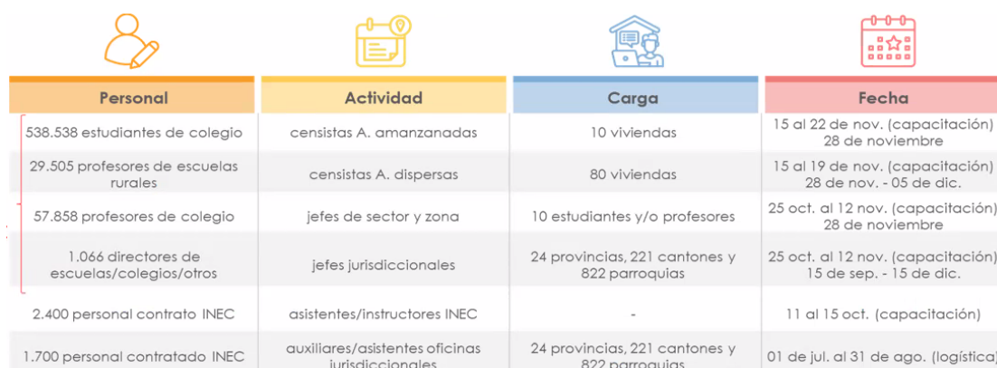
Ilustración 2: Personal requerido para el levantamiento del VIII Censo de Población y VII de Vivienda

En cuanto al impacto de la COVID-19, Santiago González sostiene que el VIII Censo de Población y VII de Vivienda es la operación estadística más importante que tiene un país, se caracteriza por realizar entrevistas directas con el informante en su hogar y ello implica la movilización de equipos de encuestadores y supervisores en campo, buscando el contacto directo con las personas, lo que sin duda, se dificulta frente a las restricciones establecidas para evitar que se den más contagios, pues se requiere de la colaboración de 626.967 personas del Ministerio de Educación (MINEDUC) y de aproximadamente, 60.000 efectivos de la Policía y Fuerzas Armadas para que participen en el levantamiento de información, del 28 de noviembre al 05 de diciembre de 2021.